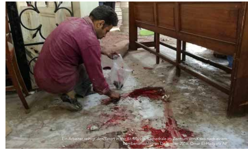
Ein Arbeiter reinigt den Tatort in der St. Markus-Kathedrale im Zentrum von Kairo nach einem Bombenanschlag im Dezember 2016.

Es gereicht Präsident Sisi zur Schande, dass der tödlichste Übergriff