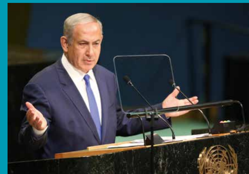
Netanjahu spricht auf der 71. Sitzung der UN-Generalversammlung.

Interessanterweise besteht die Mehrheit der Bevölkerung in Ländern, die die UNESCO-Resolution akzeptiert haben, aus Menschen, die sich als Christen bezeichnen.