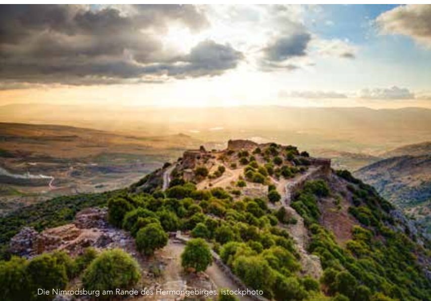
Die Nimrodsburg am Rande des Hermongebirges.

2. „Und du wirst eine prachtvolle Krone sein in der Hand des HERRN und ein königliches Diadem in der Hand deines Gottes“ (V. 3). Israel erhält keine Krone, sondern wird eine Krone sein . Jerusalem wird mit Herrlichkeit, Größe und majestätischer Eleganz geschmückt sein und die Gerechtigkeit des Herrn offenbar machen. Wie anders wird Gottes Beziehung mit Jerusalem in jenen Tagen sein verglichen mit der Zeit, als Er Sein Angesicht von einem sündigen Israel abwandte.