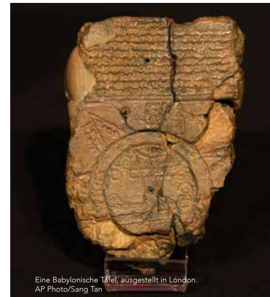
Eine Babylonische Tafel, ausgestellt in London.

verstanden sie, dass der Autor des Textes (Mose schrieb die ersten fünf Bücher Mose) Folgendes zu vermitteln beabsichtige: